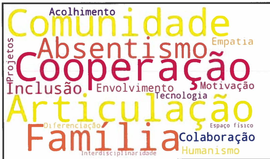
Figura 6.1 Nuvem de palavras, obtida a partir dos resultados da questão aberta “Numa ou 2 palavras, diga o que pode melhorar no Agrupamento, no próximo ano letivo.”, no inquérito “Docentes 2024/2025”. O tamanho da letra é proporcional à frequência com que a palavra foi referida.

À semelhança do trabalho desenvolvido nos anos letivos anteriores, pretende-se como Produto Final a construção do Livro do Miradouro sobre a temática, em formato analógico e digital, onde a capa e o subtítulo resultariam da participação sobretudo das disciplinas de expressões e de concursos sugeridos por outras disciplinas.